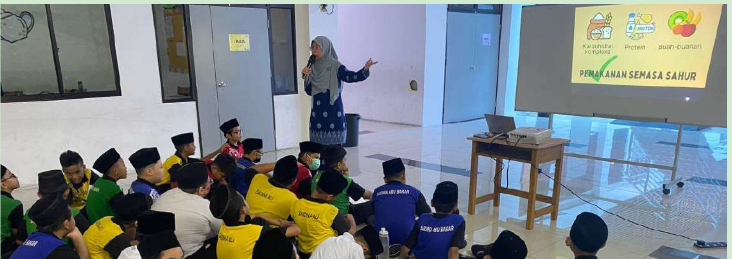
Panduan Makanan Sihat Halalan Toyyiban Ketika Bulan Ramadhan. SRI Johor Bahru. 20 Mac 2023