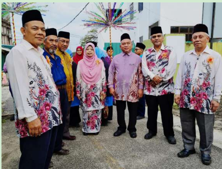
Upacara Sambutan Sempena Pemantauan Oleh Ketua Pengarah dan Pengarah-Pengarah YTP ke SERI AI Hikmah Kelantan. 18-19 Januari 2023