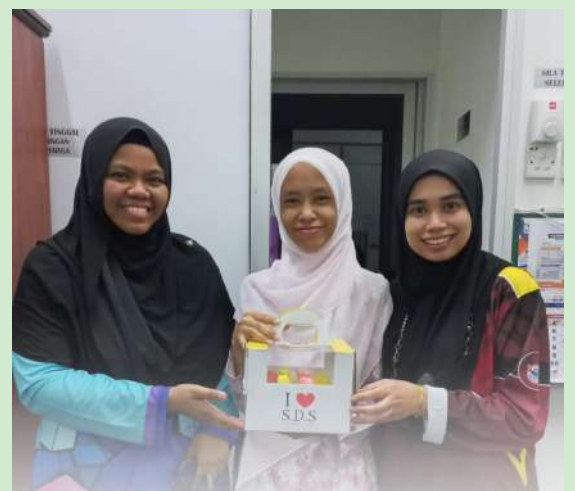
Penyerahan Kek Kepada Staf Wanita di YTP Oleh HELWA ABIM Sempena Hari Wanita Sedunia. 8 Mac 2023