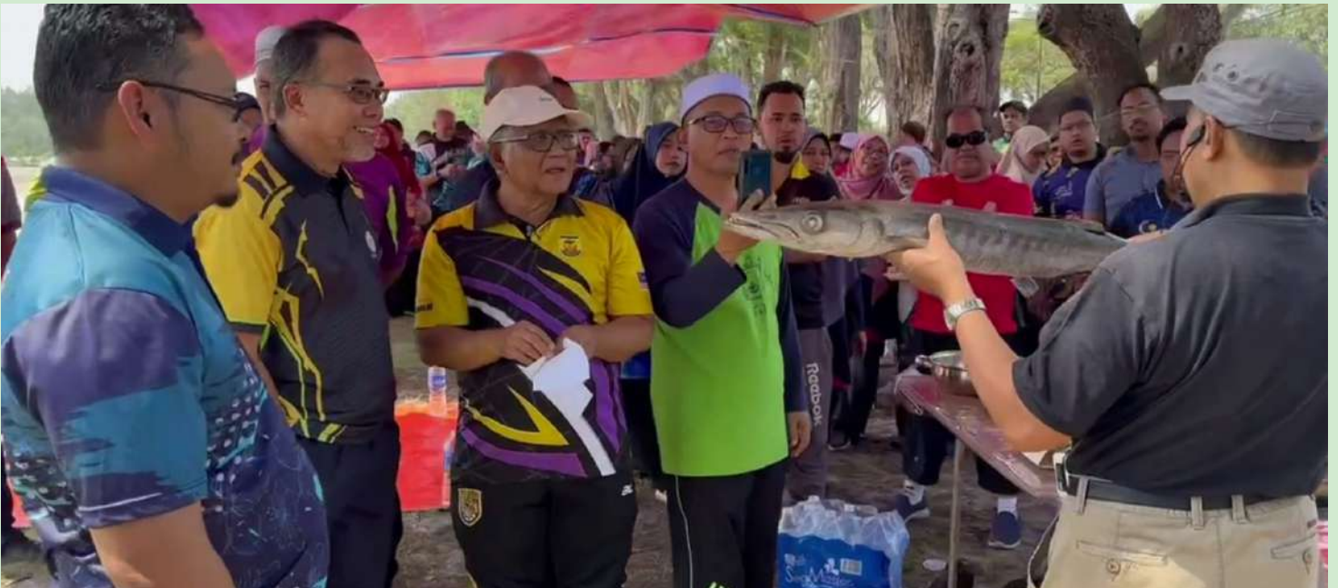
Aktiviti Tadabbur Alam Ketika Program Nadwah Murabbi Kebangsaan di Bagan Lalang, Sepang 6-8 Mac 2023