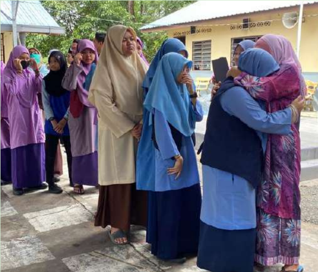
Hari Terakhir Tahun 6. Pelajar SRI Indera Mahkota, Kuantan Pahang. 17 Februari 2023