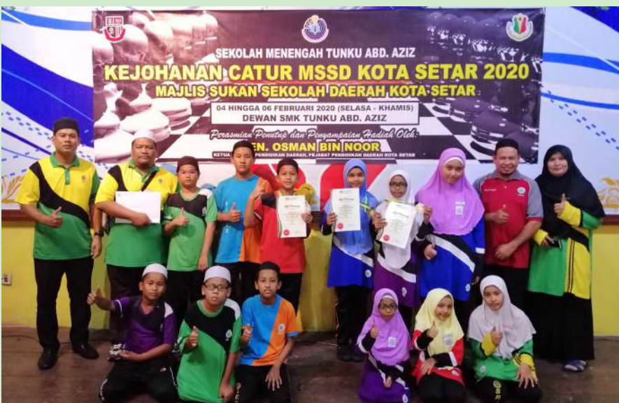
Kontijen Catur SRI Alor Setar Memenangi Johan dan Tempat Ketiga Bawah 12 Tahun Lelaki Dalam Kejohanan Catur MSSD Kota Setar Peringkat Negeri Kedah. 20-22 Februari 2023