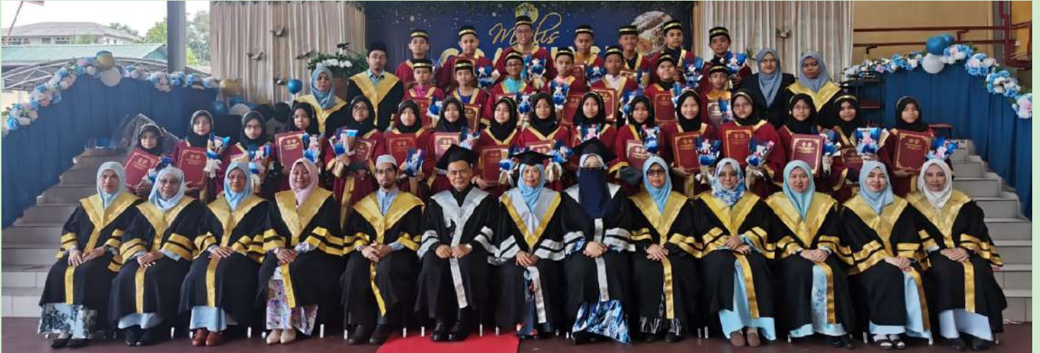
Majlis Graduasi Pelajar Tahun 6 SERI ABIM Sg. Ramal Kajang. 4 Februari 2023